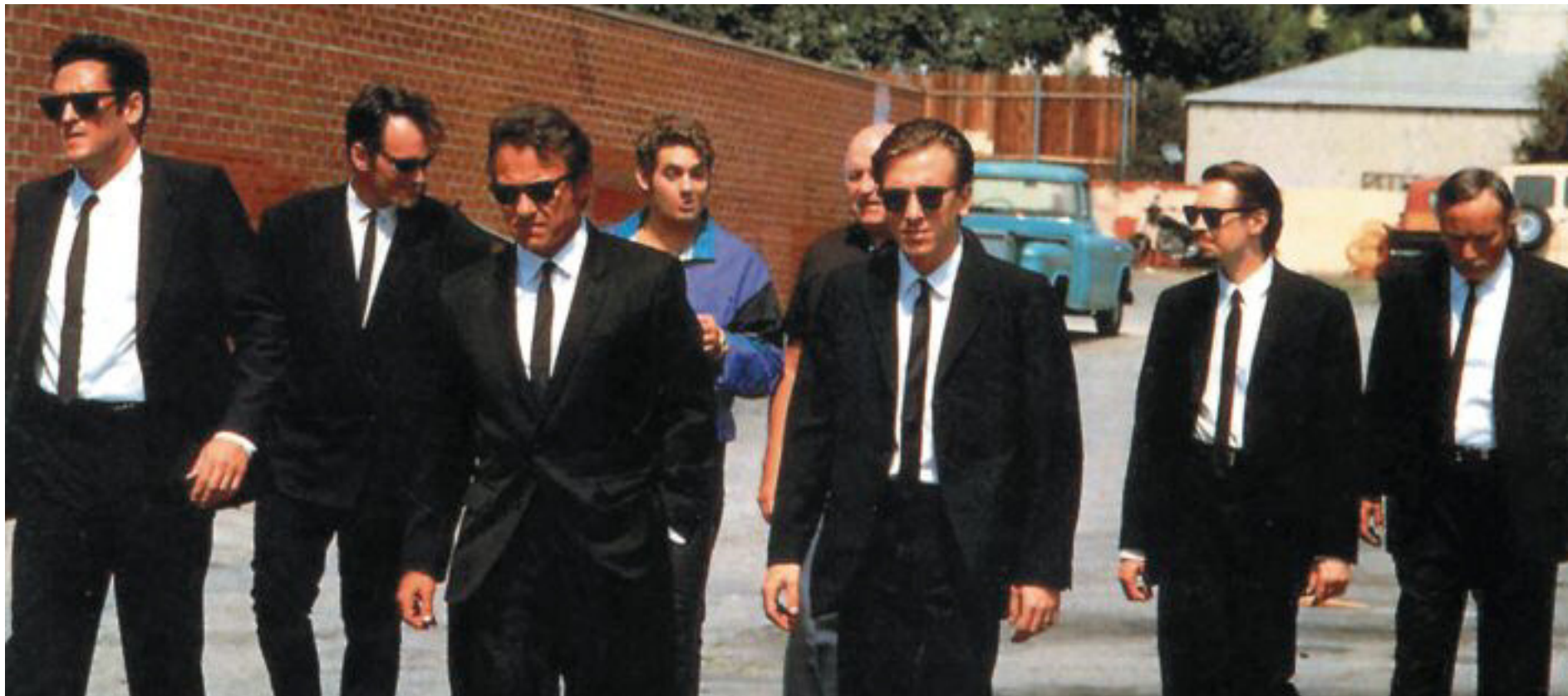
Edward Bunker (California, 1933-2005, a la derecha en la imagen) interpretó a Mr. Blue en Reservoir Dogs (1992), de Quentin Tarantino.